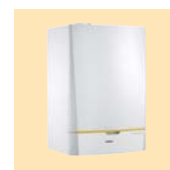
HP Inverter 22 и 27 TR-2