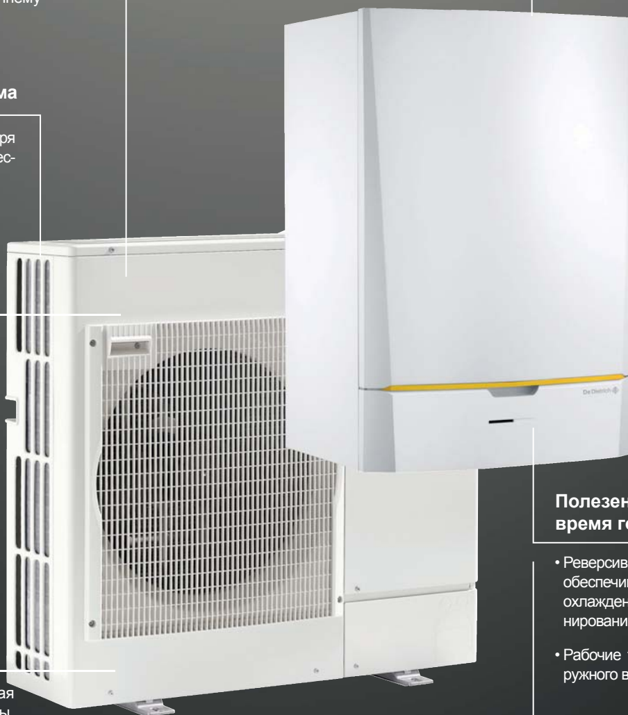
HP Inverter Evolution